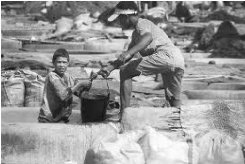
Foto: werkende jongens en werkende meisjes

We spreken over kinderarbeid wanneer kinderen moeten werken om een inkomen te verdienen of anderen helpen om een inkomen te verdienen. In de meeste landen is het onder de 14 jaar niet toegestaan om te werken. Vanaf 14 jaar mag het wel, maar alleen een beperkt aantal uren per dag en onder beschermende omstandigheden. Als hier geen sprake van is, is het ook een vorm van kinderarbeid. Na schooltijd thuis bijspringen in de huishouding of een handje helpen op het land tijdens de oogst zijn geen vormen van kinderarbeid. Tenzij het kinderen belemmert om naar school te gaan, want dan schaadt het hun ontwikkeling en noemen we het wel kinderarbeid.