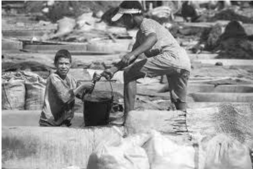
Foto: werkende jongens en werkende meisjes

We spreken over kinderarbeid wanneer kinderen moeten werken om een inkomen te verdienen of anderen helpen om een inkomen te verdienen. In de meeste landen is het onder de 14 jaar niet toegestaan om te werken. Vanaf 14 jaar mag het wel, maar alleen een beperkt aantal uren per dag en onder beschermende omstandigheden. Als hier geen sprake van is, is het ook een vorm van kinderarbeid. Na schooltijd thuis bijspringen in de huishouding of een handje helpen op het land tijdens de oogst zijn geen vormen van kinderarbeid. Tenzij het kinderen belemmert om naar school te gaan, want dan schaadt het hun ontwikkeling en noemen we het wel kinderarbeid.