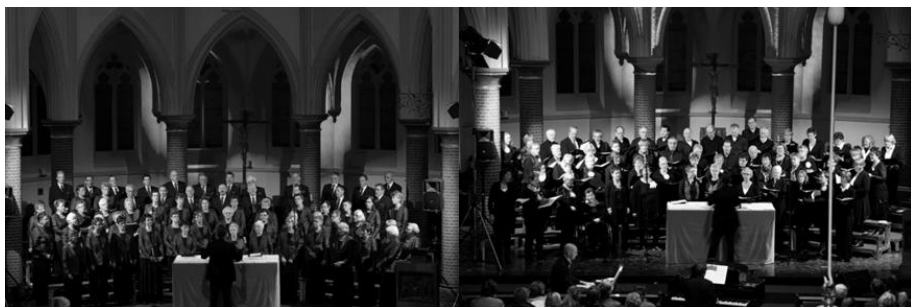
Chr. Gem. zangvereniging De Lofstem uit Emst en Interkerkelijk koor To You uit Epe beide o.l.v. Henk van der Maten