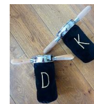
Toelichting bij de collecten

Zondag 15 februari gaat een gastpredikant bij ons voor. AMvdW